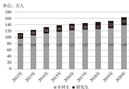
图3 2012年至2020年中国高等学校工科专业本科、研究生毕业生数