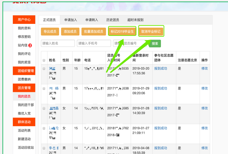
(2) “毕业年份不统一”团支部的额外操作